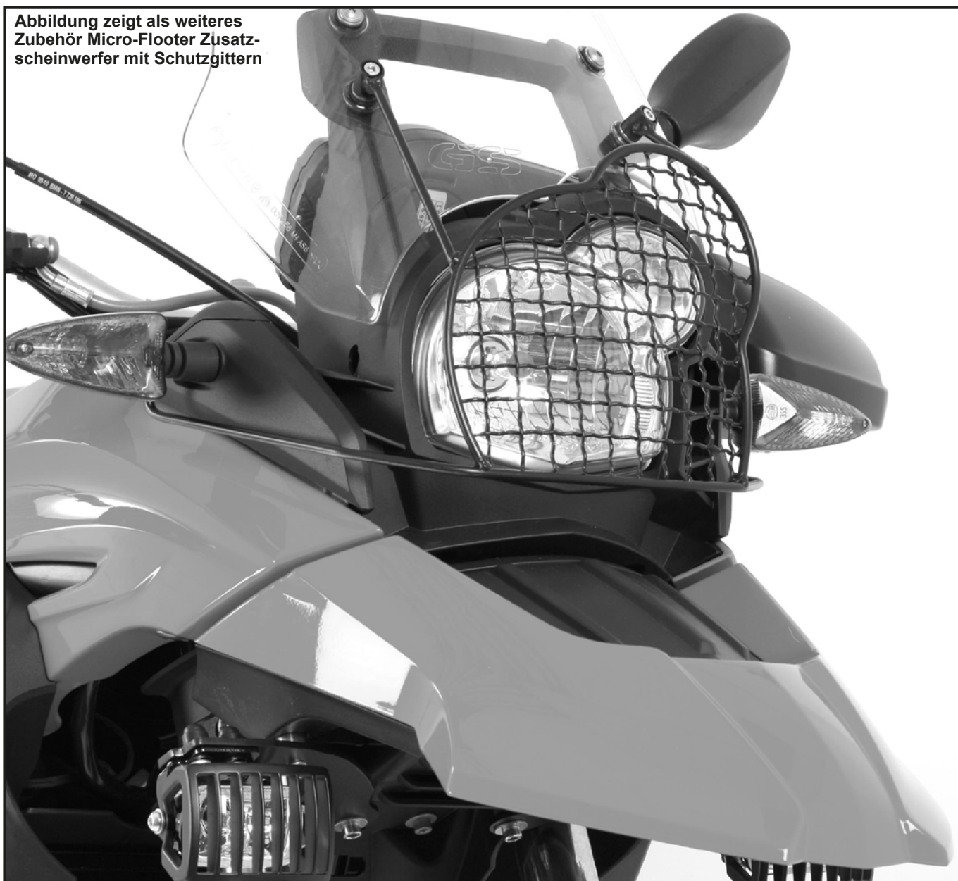
Abbildung zeigt als weiteres Zubehör Micro-Flooter Zusatzscheinwerfer mit Schutzgittern

Lampenschutzgitter in Position bringen und verschrauben. Dazu für die Befestigung an der Frontscheibe ① die Zylinderschrauben M5 x 35 verwenden. Für die Befestigung an den Blinkern die Zylinderschrauben M6x35 verwenden. ②