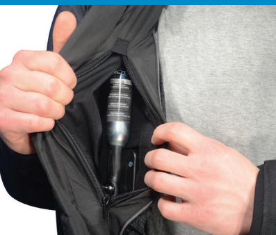
Cartucho se oculta cómodamente en bolsillo