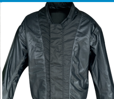
Térmico desmontable con forro resistente al agua y al viento