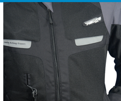
Ventilación textil gracias a la malla