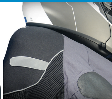
Protección óptima de cuello